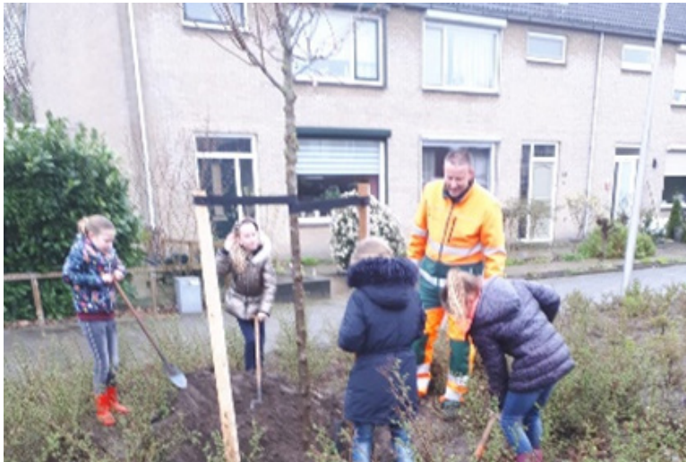
Groep 5 deed op 20 maart mee aan de Nationale Boomfeestdag.