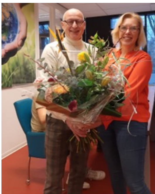
"Oud en Nieuw"